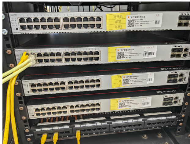
Figure 2: 机柜正面接线图