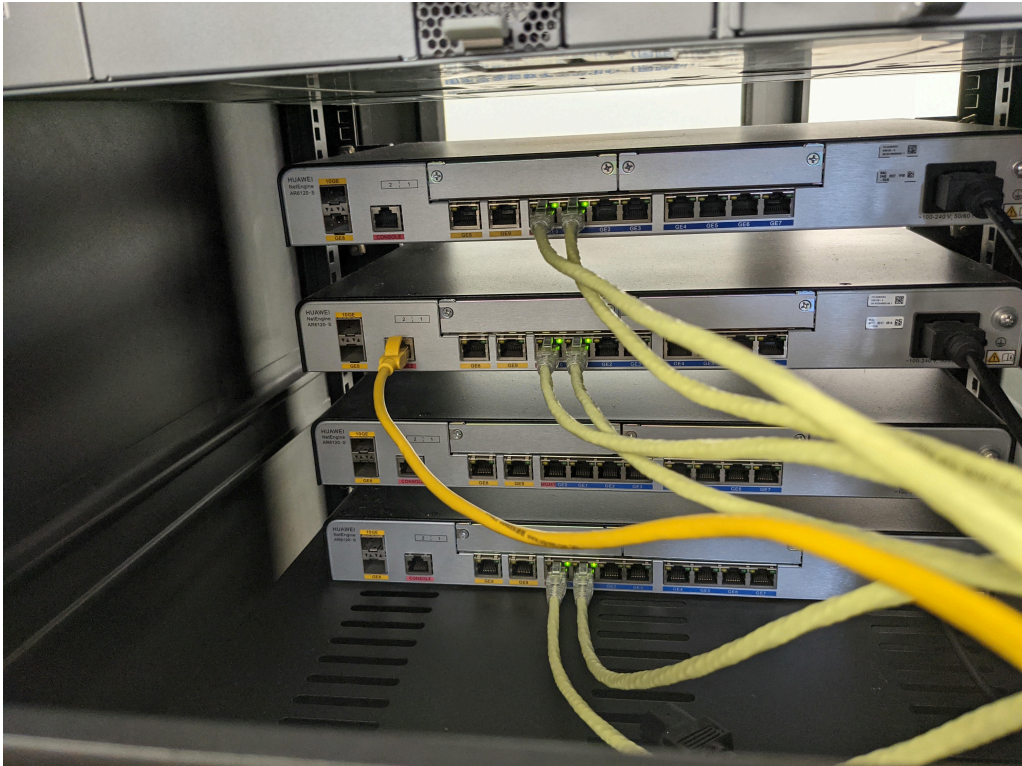
Figure 3: 机柜背面接线图