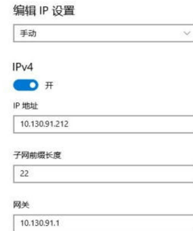
Figure 8: PC3 进行 IP 地址调整

进行该实验时先调整 PC3,4 的 IP 地址, 从 10.130.81.x/24 变为了 10.130.91.x/24。并在 PC3、PC4 上调整网关为 10.130.91.1。以 PC3 为例, 配置如下: