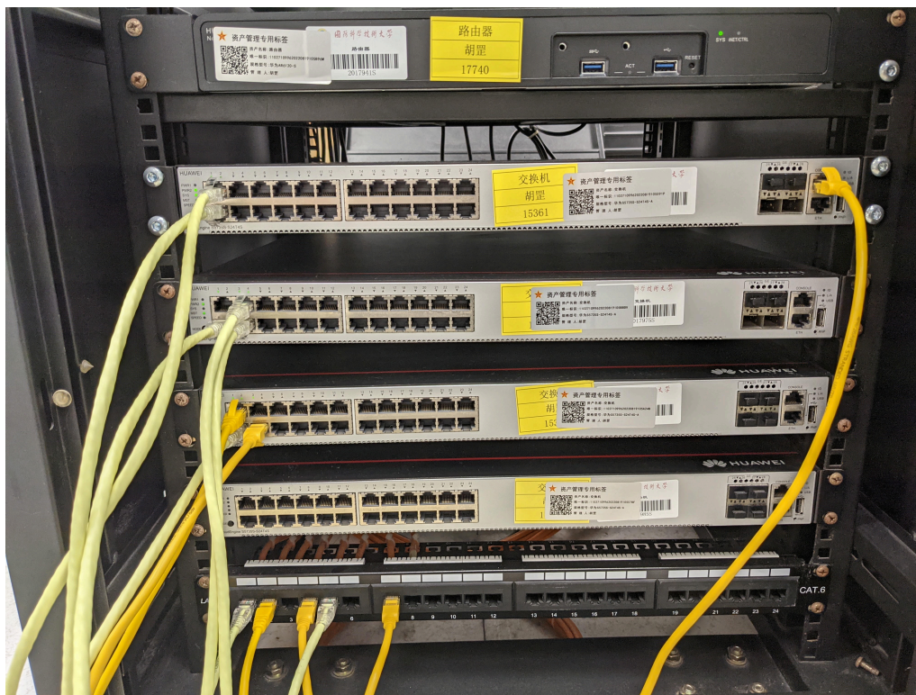
Figure 2: 接线图

按照拓扑图接线，将 PC1、PC2、PC3、PC4 分别连接到 LSW1、LSW2 上。