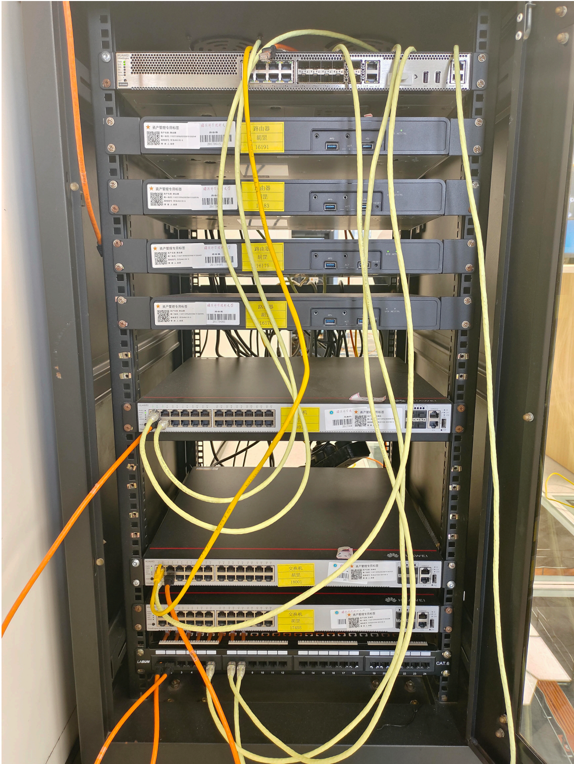
Figure 3: 机柜背面接线图