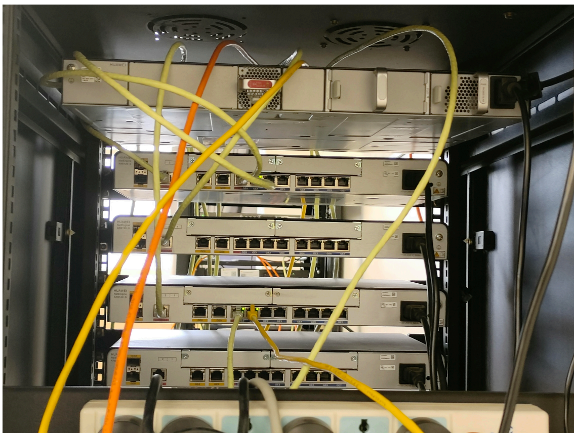
Figure 2: 机柜正面接线图