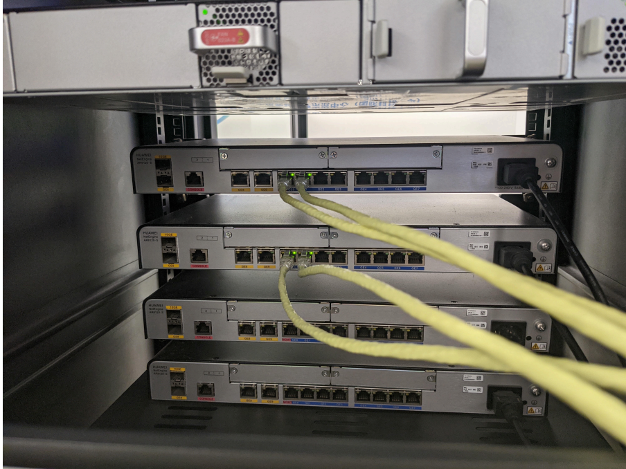
Figure 3: 机柜背面接线图