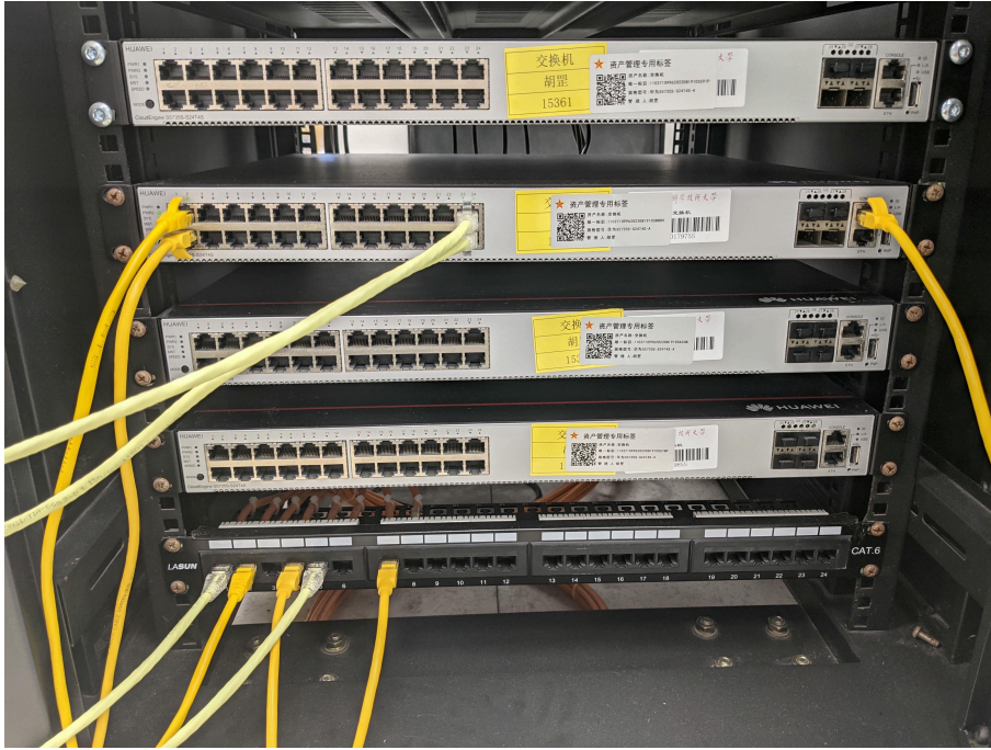
Figure 2: 机柜正面接线图